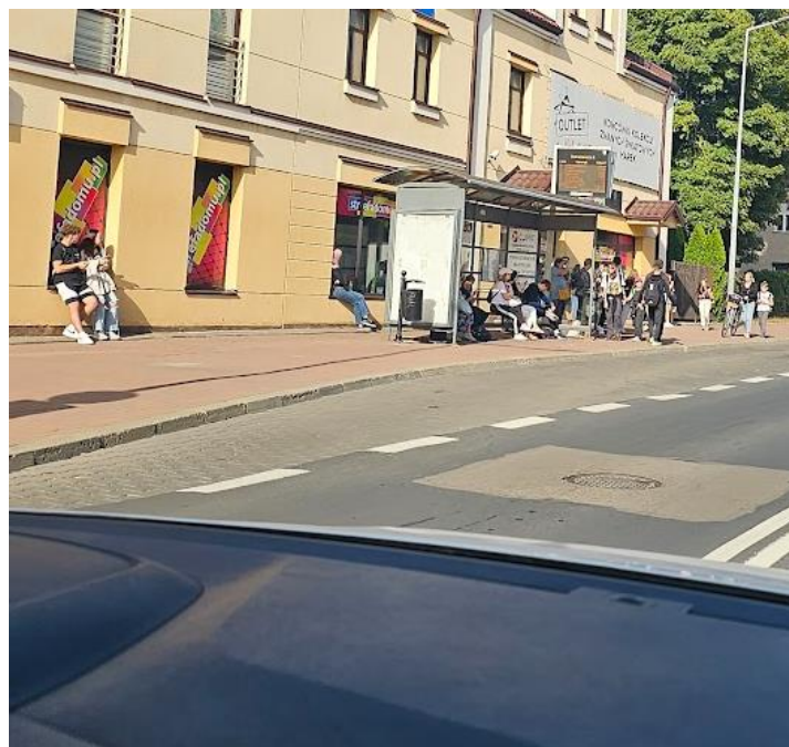
Rysunek 3 Przystanek MKZ "Narutowicza 2" w kierunku wschodnim