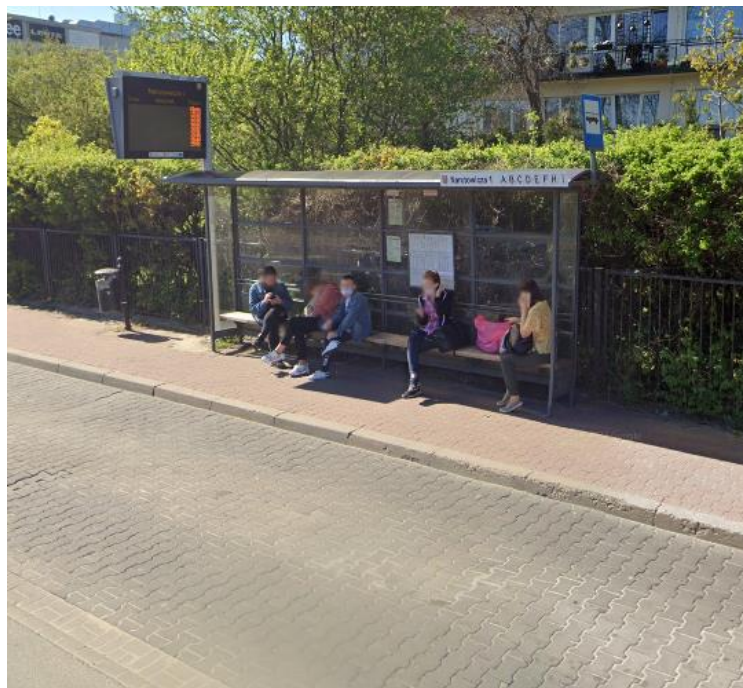
Rysunek 2 Przystanek MKZ "Narutowicza 1" w kierunku wschodnim