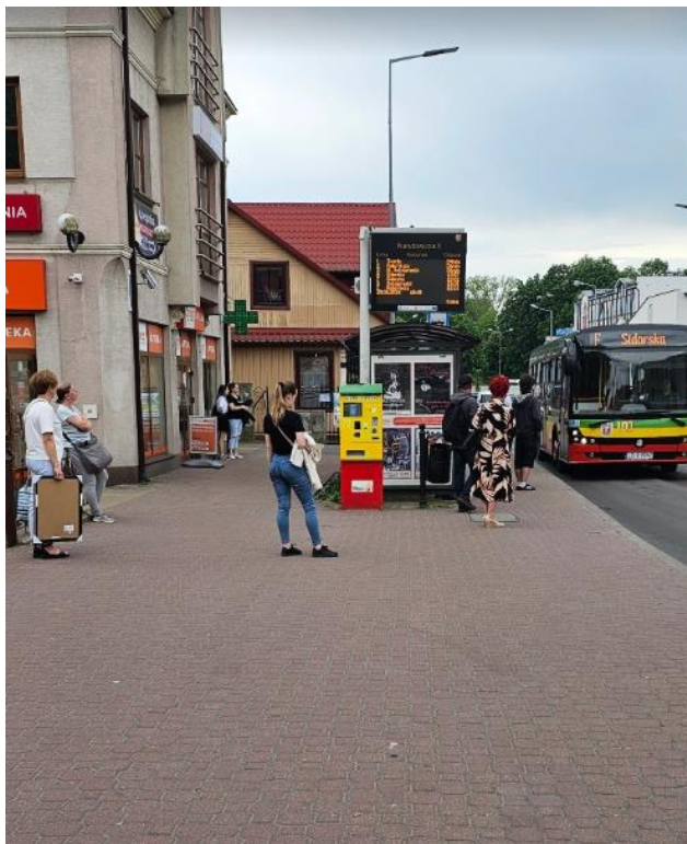
Rysunek 4 Przystanek MKZ "Narutowicza 2" w kierunku zachodnim